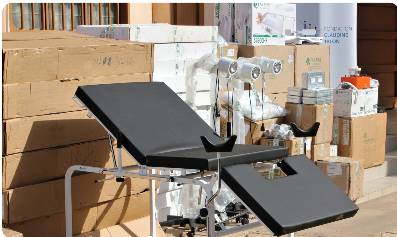
Remise d'équipements médicaux à l'Hôpital de Zone de Dassa-Glazoué, févr. 2021.