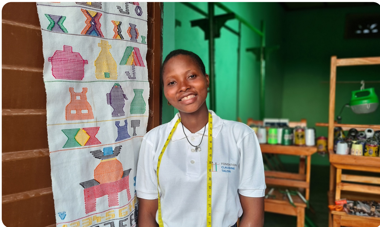
Jeune tisserande dans son atelier, Aplahoué, nov. 2021.