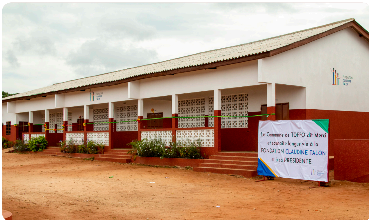
Inauguration et mise en service de l'EPP Koudjinnako, sept. 2021.