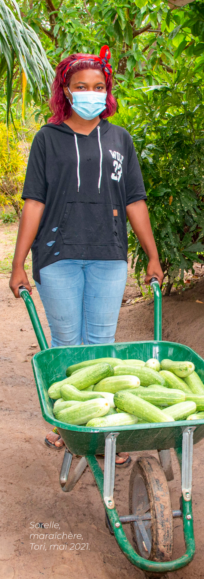
Sorelle, maraîchère, Tori, mai 2021.