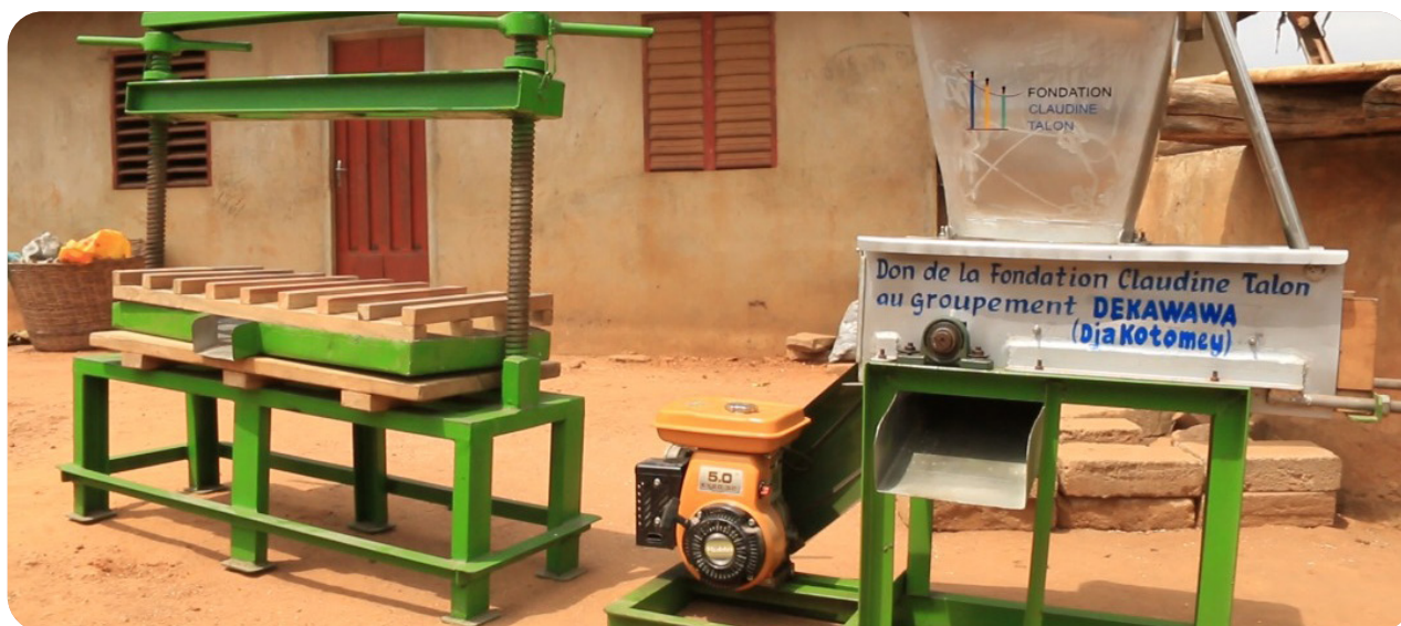
Matériel de transformation agroalimentaire remis à un groupement de femmes, Djakotomey, déc. 2021.