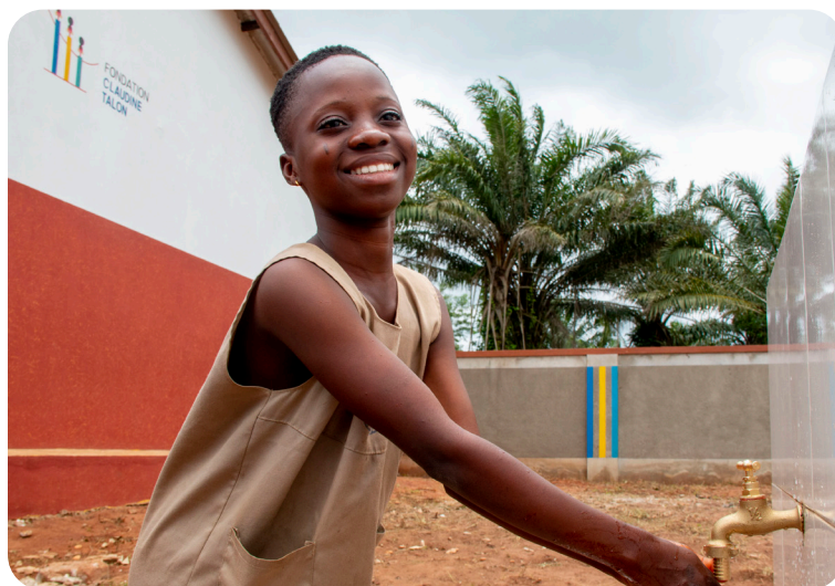
Borne-fontaine réalisée dans l'EPP Koudjinnako, sept. 2021.

Au regard des besoins de la communauté, une extension de cette école est prévue pour 2022 (extension de l'EPP et construction d'une EMP).