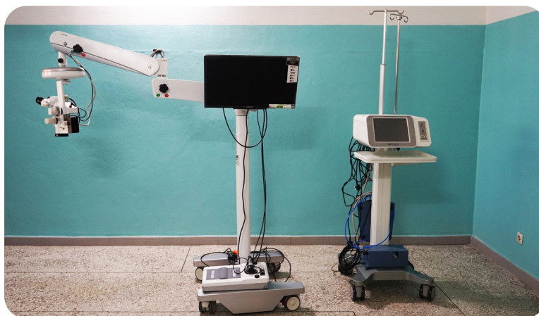
Remise d'appareils de chirurgie ophtalmologique au CNHU-HKM, Cotonou, févr. 2021.

Par ailleurs, deux appareils modernes de chirurgie ophtalmologique donnés à la Fondation Claudine Talon par la société ARISE IIP ont été mis à disposition du service d'ophtalmologie du CNHU-HKM pour un traitement efficace de cette affection.