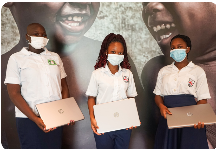
Gratification des meilleurs lauréats du BAC, Cotonou, déc. 2021.

Ainsi 58 bacheliers ont reçu un ordinateur portable. Les 100 premiers au BEPC ont bénéficié d'une tablette numérique, et ceux du CEP d'une tablette éducative.