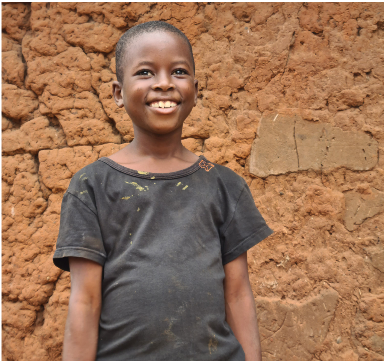
Jeune bénéficiaire d'une action de la Fondation Claudine Talon, Klouékanmè, juin 2021.

À cet effet elle met en place des solutions durables dans les domaines de la santé, de l'hygiène, de l'éducation et de l'autonomisation des femmes.