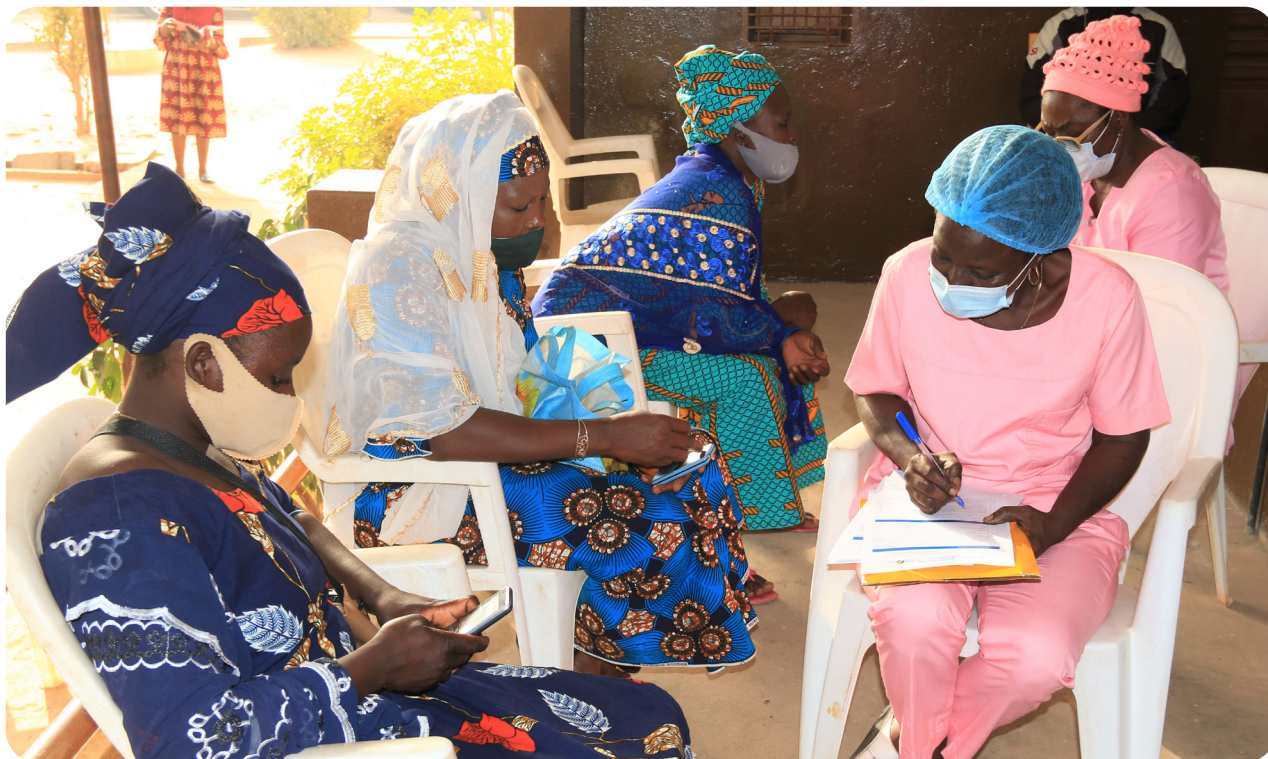
Dépistage des lésions précancéreuses du col de l'utérus au CHUD-BA, Parakou, mars 2021.