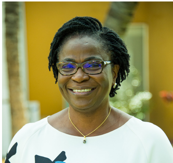
CLAUDINE TALON PRÉSIDENTE DE LA FONDATION

Merci à nos donateurs, à nos partenaires et à nos bénévoles pour leur accompagnement constant.