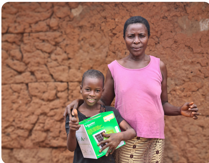
Distribution de lampes solaires, Azovè, juin 2021.