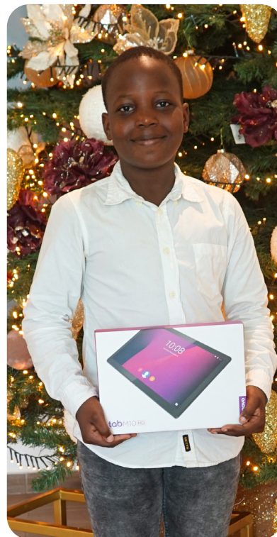
Récompense des meilleurs lauréats du BAC, du BEPC et du CEP, Cotonou, déc. 2021.