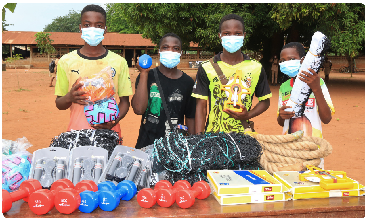
Récompense du CEG1 Adjarra, 3 e lauréat de l'Examen Rouge, Adjarra, mai 2021.