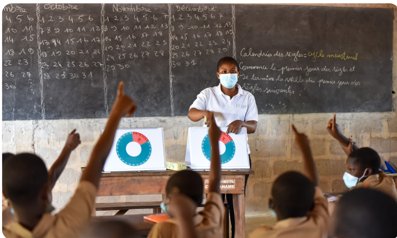
Formation des jeunes filles du CEG Banamè à la GHM, Zagnanado, nov. 2021.