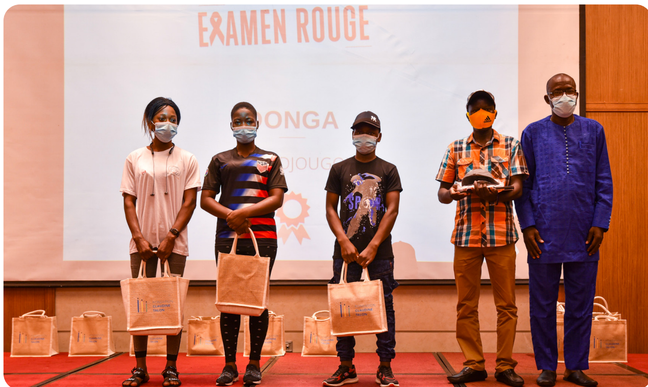
Cérémonie de clôture du jeu-concours Examen Rouge (équipe du CEG2 Djougou, 1 re lauréate), Cotonou, déc. 2020.