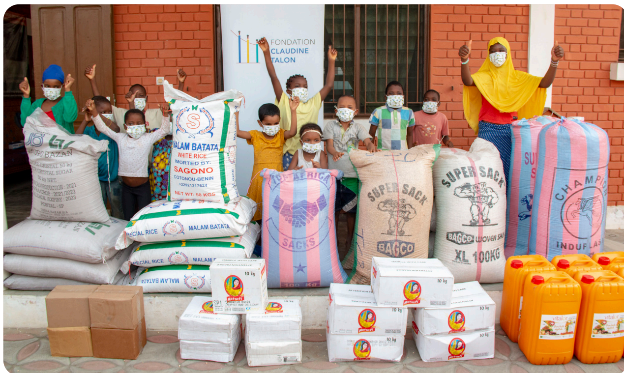
Distribution de vivres dans un orphelinat, Cotonou, déc. 2021.