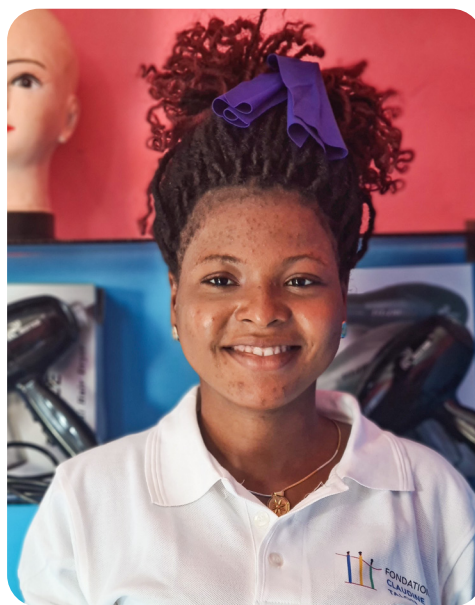
Jeune coiffeuse dans son salon, Lokossa, nov. 2021.

Par ailleurs, 210 autres jeunes filles de la deuxième promotion ont poursuivi leur apprentissage.